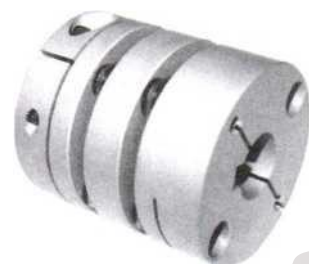
★外形图 KM4B 系列